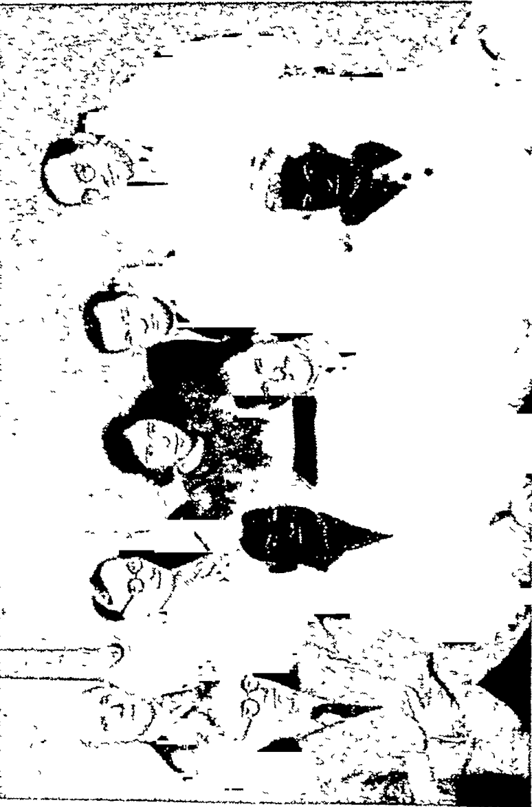
लेनिनग्राद युनिवर्सिटी के भारत-तत्व विभाग के अध्यापक और अध्यापिकाएँ